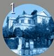
2ος παιδικός σταθμός (Κτίριο Αγγελέτου)